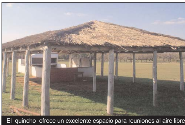
El quincho ofrece un excelente espacio para reuniones al aire libre

bilidades de recreación que brindan, en el encontraran baños instalados con capacidad para 250 visitantes,