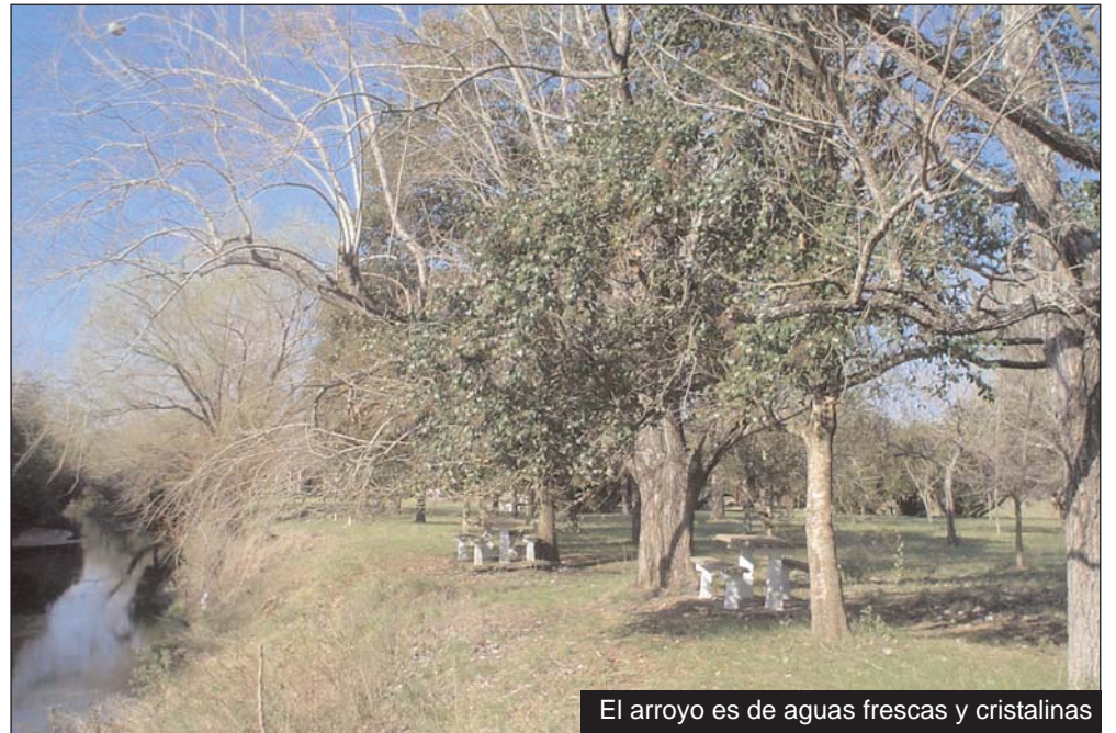
El arroyo es de aguas frescas y cristalinas

D urante el mes de Agosto , el Sindicato de la Carne de concepción del uruguay y el Sindicato Hermano de los petroleros firmaron un convenio para el uso de las instalaciones del camping "Diego Ibáñez" de dicho sindicato. Mediante este convenio los afiliados a este sindicato pueden acceder gratuitamente a estas instalaciones ubicadas a orillas del arroyo Molino, y además tener un descuento del 50% en las tarifas del campamento. En esa oportunidad, recorrimos las instalaciones del camping y comprobamos el excelente estado y las posi-