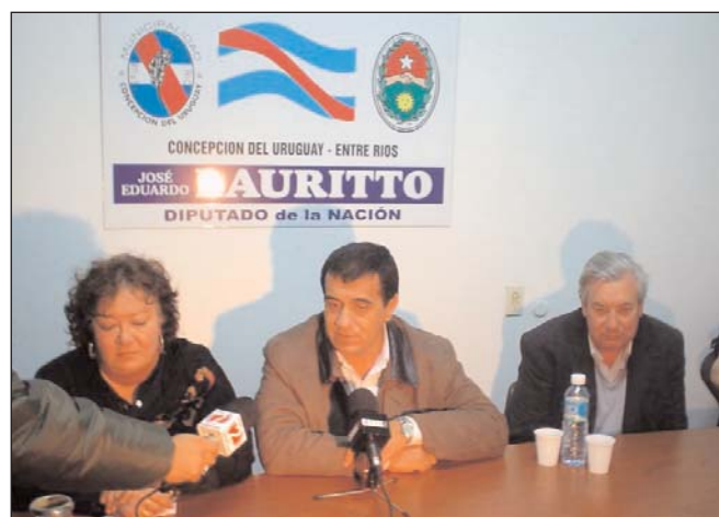
José Cáceres, presidente del I.A.P.V. da detalles de los planes de gobierno respecto a la vivienda