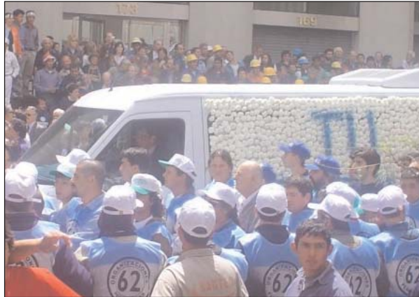
El brazo político del movimiento obrero estuvo presente, acompañando en cada momento.