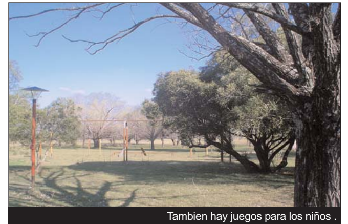
Tambien hay juegos para los niños .

El predio ubicado a 2 kilómetros del kilómetro 131½ de la ruta 14 y de 10 hectáreas cuenta con 2 canchas