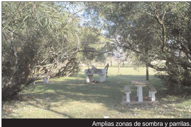
Amplias zonas de sombra y parrillas.

rrillas, con Sombra de arboledas naturales y juegos para los chicos que además de las cristalinas y poco pro-