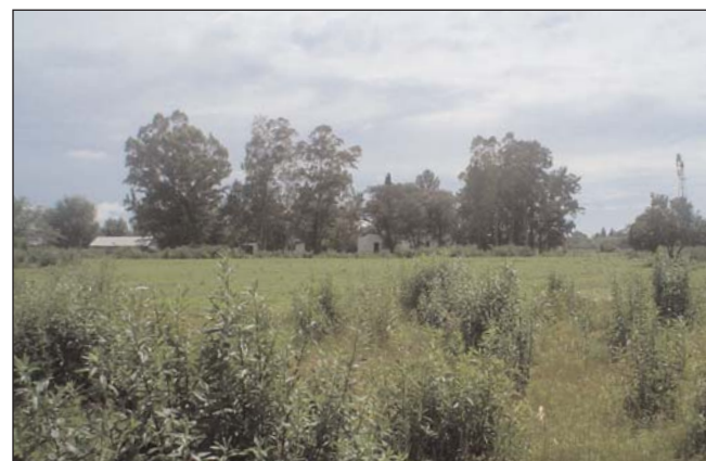
En este terreno de 9500 mts2 se construira un polideportivo para los afiliados al sindicato