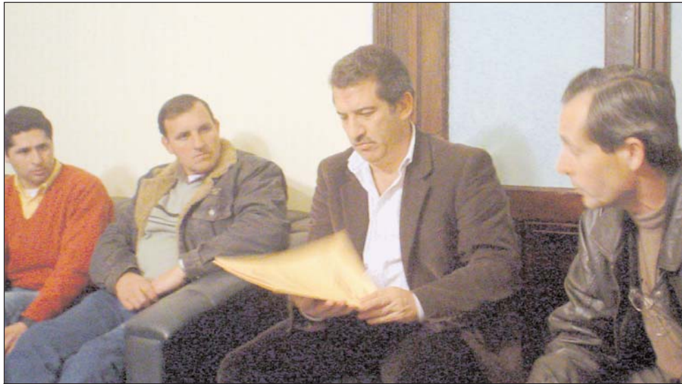
El Ministro Urribarri recibe la carpeta con el plan de viviendas.

Durante la charla el ministro mostró el apoyo que la gobernación expresa a los sindicatos y su actividad y a su vez adelantó que se encuentra a disposición de los mismos para ayudar en todo lo que este a su alcance, también habló de la tarea de las direcciones provinciales de trabajo en cada departamento y como estas en conjunto con los sindicatos están traba-