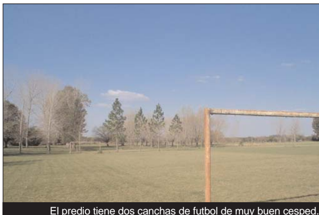
El predio tiene dos canchas de futbol de muy buen cesped.

fundas aguas del arroyo prometen días de tranquilidad y seguro esparcimiento para toda la familia.