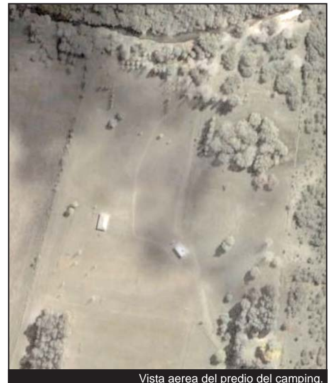
Vista aerea del predio del camping.

mite la realización de eventos y reuniones. A la Orilla del Arroyo molino se tiene otra sección de pa-